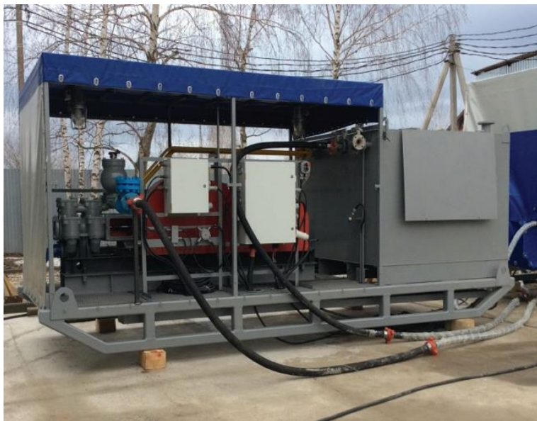
Блок Силовой установки УМП