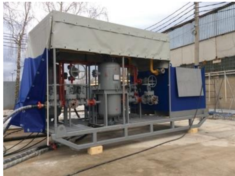
Блок Управления установки УМП